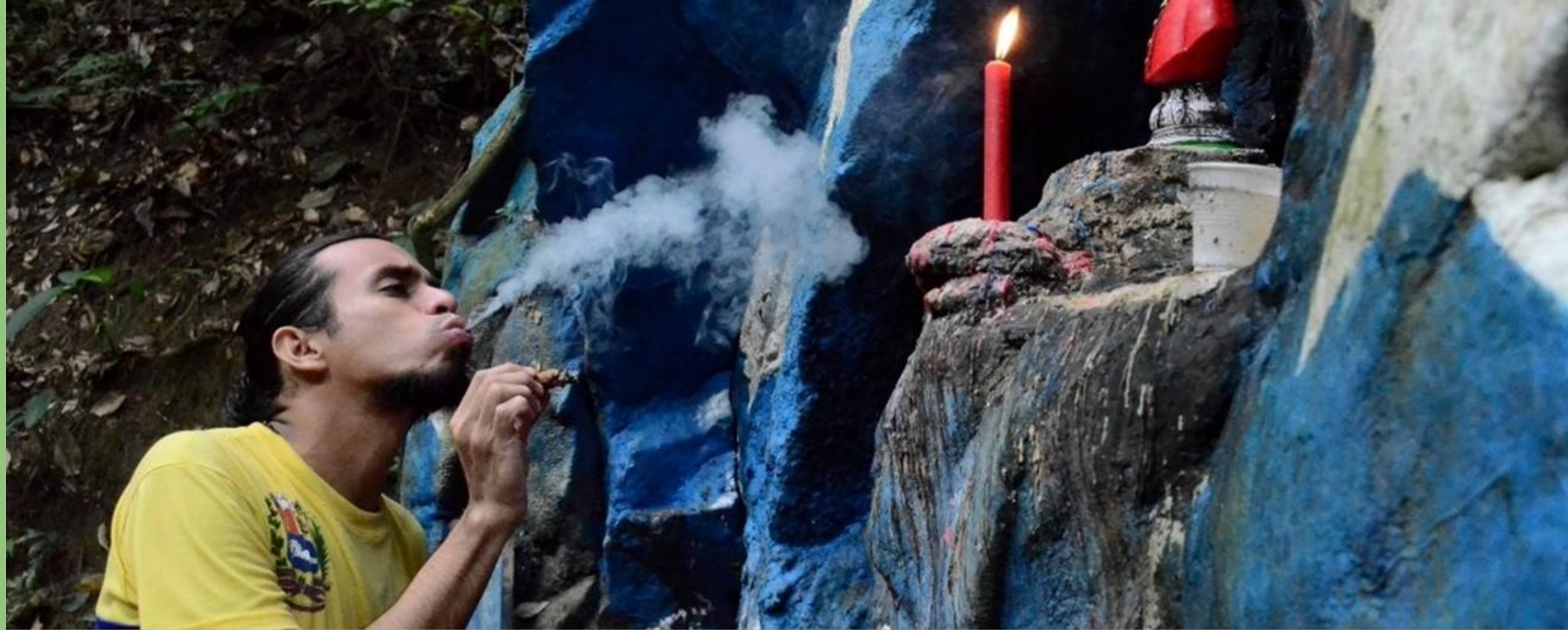
Imágenes de la Religión de María Lionza